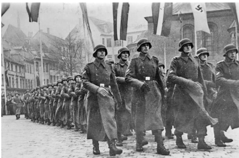
Illustration PHOTO - Wikimedia commons